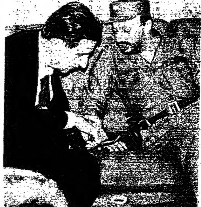
ياسر عرفات وجنيلات اثناء اجتماعهما امس